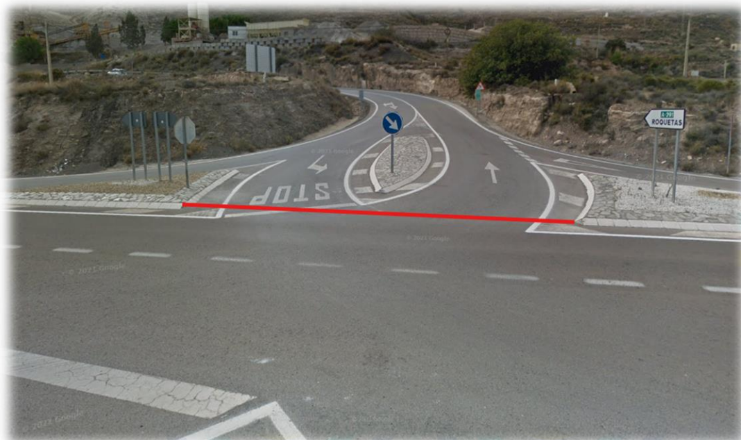
A-391 km 26,000 - (cruce con A-348)