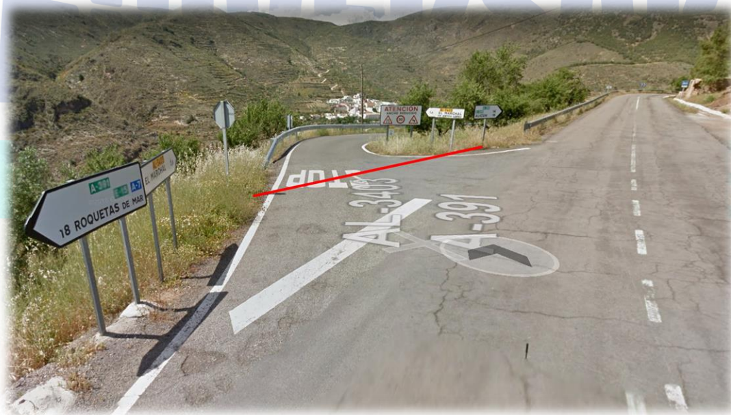
AL-3403 km 0,000 - (intersección con A-391)

AUTOMÓVIL CLUB DE ALMERÍA · Av. Federico García Lorca, 42 - 04004 Almería · t 950265885 · m 615345054 · info@automovilclubdealmeria.com